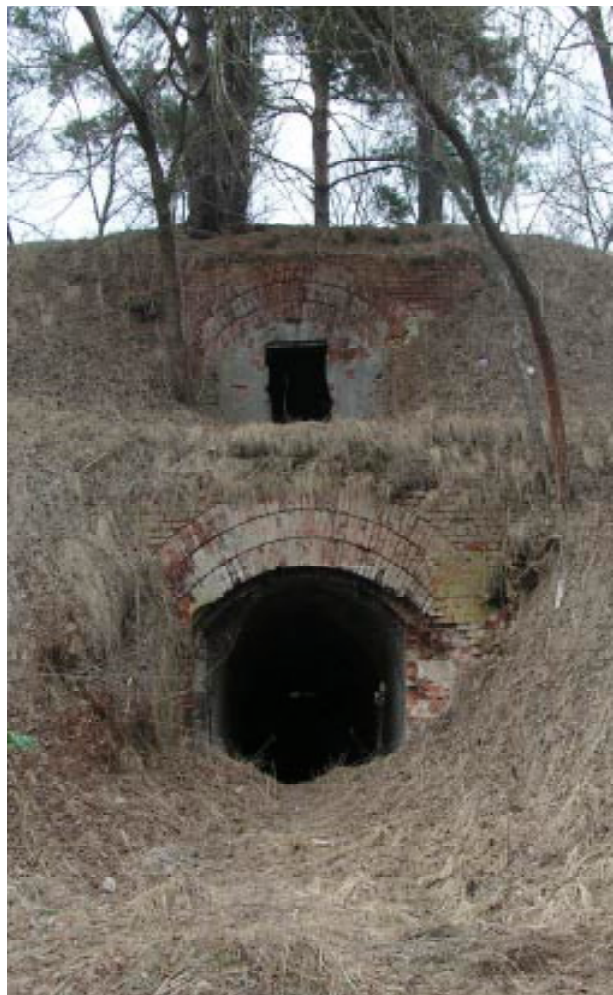
Рис.3. Фрагмент форта №1 в р-не д. Козловичи. Брестский р-он