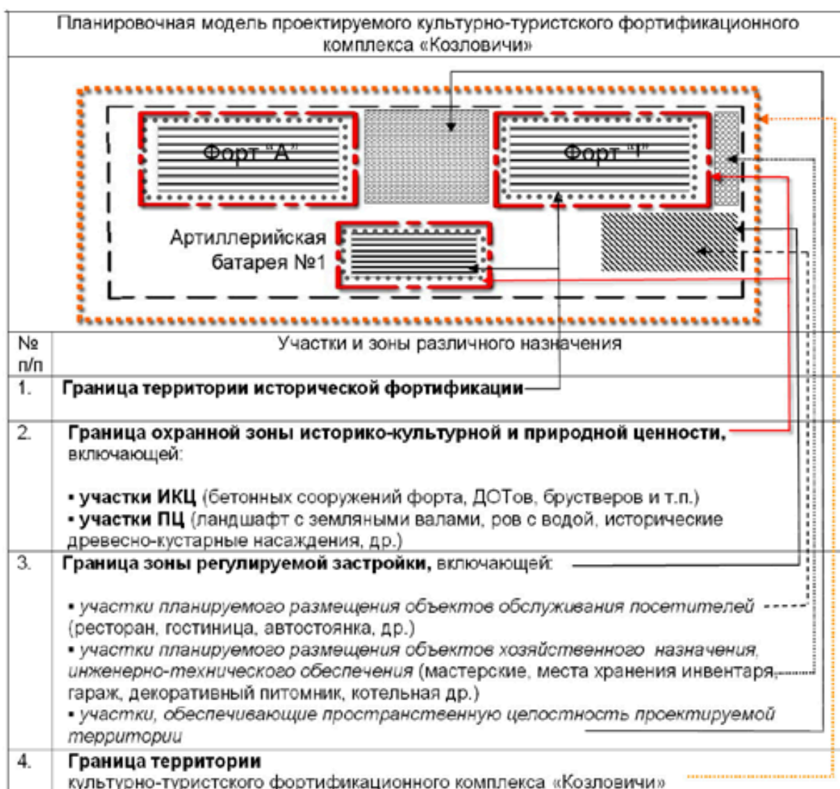
Участки историко-культурных ценностей и зоны их охраны подлежащих включению в границы проектируемой территории культурно-туристского фортификационного комплекса «Козловичи».