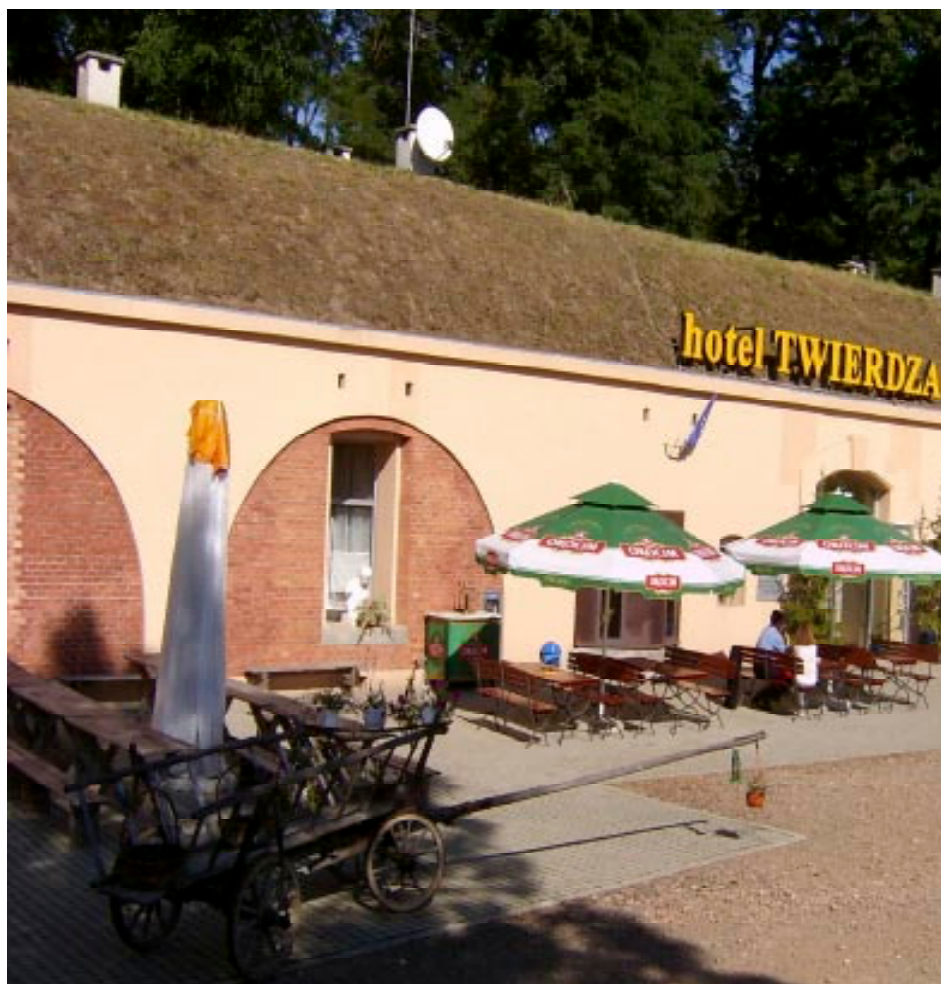
Рис. 2. Пример приспособления форта под гостиницу, район г. Кракова. Польша, 2006 г.

Некоторые фортификационные сооружения начала XX в. сегодня постепенно включаются в современную жизнь (музей в ДОТах Заславьского укрепрайона - открыт в 2005 г., музей в форту №