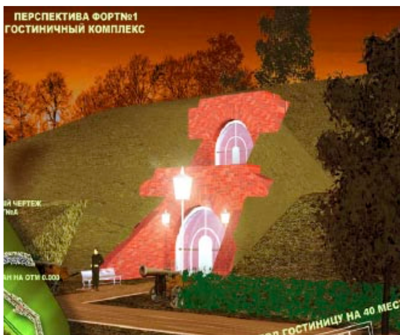
Рис.4. Приспособление форта №1 в р-не д. Козловичи. Брестского р-на под туристскую гостиницу, арх. Власюк Н.Н.

В проекте детально рассматривается форт № «А», расположенный в д. Козловичи, вблизи город-