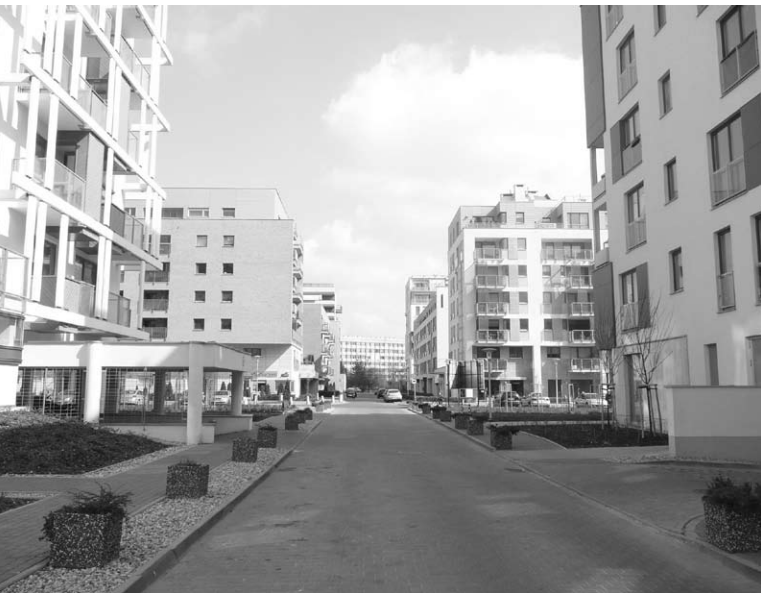
Ryc. 5 i 6. Eko-Park – przestrzeń publiczne: główny plac (agora) i jedna z ulic.

dla (placu-agory). Jego charakter tworzony jest przez zieleni oraz zadaszony pasaż - galerię, która jest obowiązkowym elementem wschodniej elewacji każdego z kwartałów dzielnic zachodnich, i która chroni wejścia do umieszczonych w parterach pomieszczeń drobnego