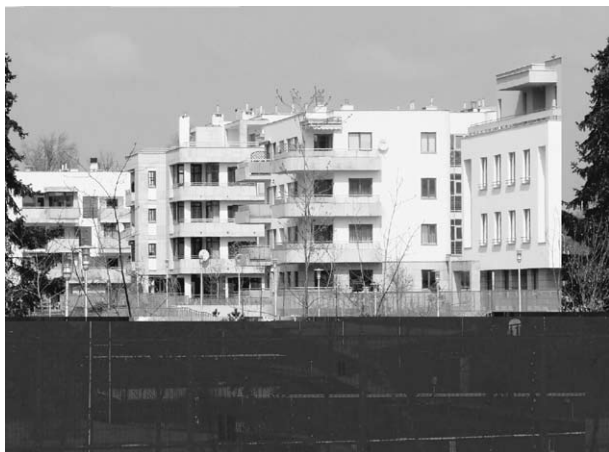
Ryc. 3. Marina Mokotów – na pierwszym planie systemu ogrodzeń, na drugim widoczne modernistyczne punktowce zlokalizowane w części wschodniej. Fot. autor

regularną linię pierzei, od strony zachodniej – budynki o wysokości 7 kondygnacji, wyznaczające sztywną linię pierzei. Wschodnią część osiedla zakomponowano na czytelnie zdefiniowanej siatce ulic, które wyznaczają poszczególne kwartały zabudowy, o skali nawiązującej do zabudowy znajdującej się w sąsiednich kwartałach Mokotowa.