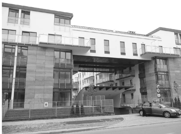
Ryc. 12. Miasteczko Wilanów – oryginalne rozwiązanie wjazdu do parkingu podziemnego w kwartale Aura Park.

Osiedle Marina - jest miastem w mieście, jest w większości odwrócone od otaczającej zabudowy, jest tworem wyalienowanym – niedostępnym dla miejskiego przechodnia - tworzącym sztuczny świat ze sztucznym jeziorem. Ciekawe rozwiązanie przestrzenne to zbiornik wodny – z kamiennymi brzegami,