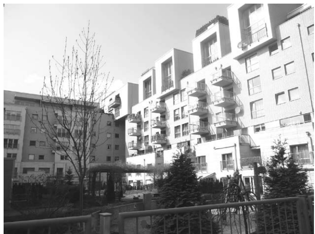
Ryc. 7. Eko-Park – przykład wnętrza kwartału jednej z „jednostek sąsiedzkich”.

Każda z „dzielnic” podzielona została z kolei na cztery do ośmiu kwartałów – zespołów skupionych wokół zielonego dziedzińca i obsługiwanych jednym wjazdem do parkingów podziemnych. Wielkość poszczególnych kwartałów to od 80 do 150 mieszkań tworzących wspólnotę – „jednostkę sąsiedzką” (ryc.7). Wspólnoty mają własny zarząd, obowiązek troszczenia się o przypisaną im zieleni, natomiast poszczególne kwartały odrębny charakter architektury, który wpływa na tożsamość miejsca 3 . Zespoły tworzące całe osiedle Eko-Park były projektowane przez różne pracownie architektoniczne, wylaniane w procesie konkursów. Główną intencją autorów było stworzenie przestrzeni miejskiej o zróżnicowanym charakterze i czytelnie zdefiniowanych przestrzeniach publicznych, przy jednoczesnym utrzymaniu związków z terenami istniejącej zieleni miejskiej i wzbogaceniu jej o nowe przestrzenie zielone. Tworzą je: zieleni publiczna przy bulwarze, stanowiącym kręgosłup układu komunikacji północ – południe, ogólnodostępny teren parku wzdłuż granicy zachodniej i zielone wnętrza kwartałów mieszkalnych, łączące się z przestrzeniami publicznymi i zielenią parkową.