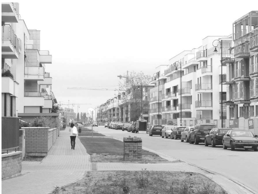
Ryc. 13. Miasteczko Wilanów – proporcje jednej z ulic, partery budynków bez funkcji handlowych i usługowych.

uważyć, że współcześnie realizowane zespoły mieszkaniowe powinny uwzględniać nie tylko warunki przestrzenne, ale i ekonomiczne. Duże obszary zespoły powinny spełniać także inne kryteria, wynikające również z potrzeb miasta (Thill, 2004). W niektórych przypadkach zabrakło zdecydowanie dobrego planowania na poziomie gminy, co doprowadziło do stworzenia osiedla zamkniętego, wyodrębnionego z przestrzeni miasta. Zaistniała polityka sprzedaży przestrzeni publicznej, bez jasnego sformułowania warunków co do zasad jej kształtowania i dostępności. Właściwa relacja środowiska mieszkaniowego do przestrzeni publicznych, dobre wkomponowanie w istniejący kontekst miejski, wielofunkcyjność i uwzględnienie rozwiązań proekologicznych to cechy, które powinny charakteryzować środowisko mieszkaniowe XXI wieku.