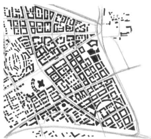
Ryc. 8. Koncepcja urbanistyczna Miasteczka Wilanów, 1999. Rys. autor

Miasteczko Wilanów to realizacja koncepcji urbanistycznej o wielkiej skali w nowej części Wilanowa – jednej z najbardziej znanych, prestiżowych dzielnic mieszkaniowych Warszawy. Wilanów słynie przede wszystkim ze swoich walorów turystycznych i zabytków, m.in. XVII-wiecznego pałacu króla Jana III Sobie-