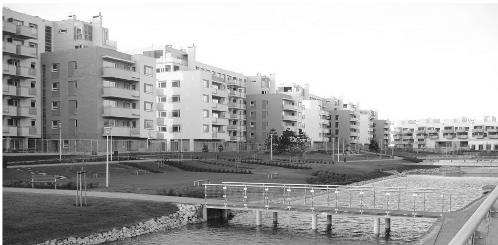
Ryc. 2. Marina Mokotów – przestrzeń publiczna (jezioro) wewnątrz osiedla zamkniętego.

Podstawą założenia urbanistycznego osiedla Marina Mokotów jest zlokalizowanie na osi północ-południe obszaru rekreacyjnego w formie krajobrazowego parku, ze zbiornikiem wodnym (ryc.2). Od strony północnej założenie to zamyka budynek apartamentowy, zaprojektowany na planie tuku, który – w zamyśle autorów – stanowi pierzeję placu „court d'honneur”, stanowiącego wejście do osiedla. Od strony wschodniej teren parku z jeziorem otacza zabudowa w formie czterokondygnacyjnych willi miejskich, tworząca nie-