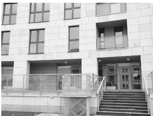
Ryc. 9 i 10. Miasteczko Wilanów - pochylnie i winda dla osób niepełnosprawnych na wózkach.