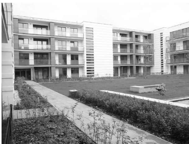
Ryc. 11. Miasteczko Wilanów - zielone wnętrze jednego z kwartałów (zamknięta przestrzeń półpubliczna).

darowany atrakcyjną roślinnością. W takich domach i w takim otoczeniu mieszkańcy będą z pewnością czuli się przyjemnie i komfortowo oraz w pełnej harmonii z naturą. Niemal wszystkie kwartały wyposażono w parkingi podziemne, rozwiązując problem parkowania (ryc.12).