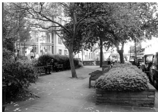
Ryc. 6. St Anne i St Agnes.

Plac przy kościele istniał już w XIII wieku Kościół został zniszczony podczas wielkiego pożaru i II wojny światowej. Odrestaurowano go w 1963 roku, a w początkach lat siedemdziesiątych XX w. założono ogród. Jest to przestrzeń trawiasta z kilkoma płytami nagrobnymi, którą okala niski kamienny mur. Plac rozciągał się w kierunku wschodnim i południowym. W czasie rozbudowy Noble Street ogród połączono z sąsiednim od strony północnej, tworząc jedną wspólną przestrzeń wypoczynkową. Wielkość: 0,1323 ha. Dostępny bez ograniczeń. Zieleń: drzewa (m.in. klon, lipa, robinia, platan, jesion, jarzębina, czereśnia), krzewy, trawniki. Inne elementy wyposażenia: ławki.