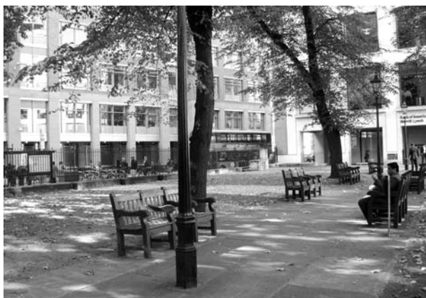
Ryc. 4. Christchurch Greyfriars Churchyard. Fot. autorka

Dawny cmentarz przy kościele franciszkanów przekształcony w publiczny ogród w 1872 roku. Kościół, zniszczony w czasie wielkiego pożaru, został później odbudowany jako dużo mniejszy. Teren niezabudowany przekształcono w cmentarz. Od 1931 roku City of Corporation płaci dotacje na rzecz utrzymania parku. Wielkość: 0,1231 ha. Dostępny bez ograniczeń, ogrodzony. Zieleń: nawierzchnia trawiasta, liczne stare drzewa. Inne elementy wyposażenia: ławki, dwa popiersia nagrobne oraz płyty nagrobne w posadzce.