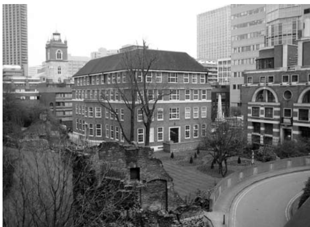
Ryc. 10. Barber Surgeon's Hall Garden.

http://www.fmschmitt.com/travels/England/london/londonwall/fort.html