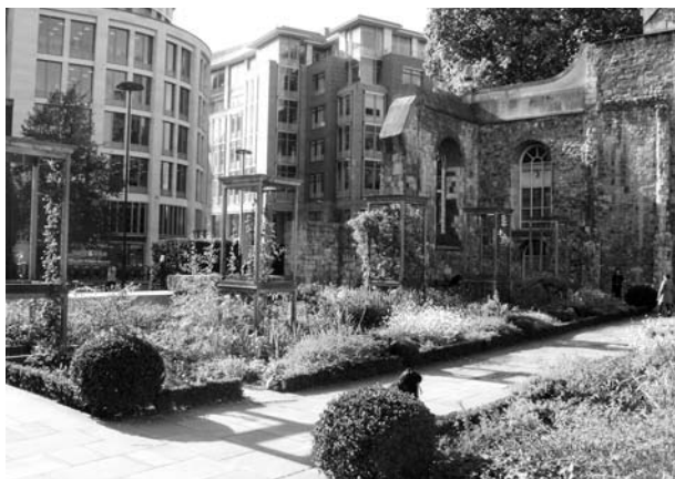
Ryc. 3. Christchurch Greyfriars Church Garden.