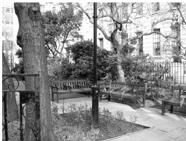
Ryc. 9. Seething Lane Gardens.

Prostokątny, wąski, niewielki ogród, usytuowany symetrycznie wzdłuż głównej alejki. Po obu stronach wejścia posadzone są rabaty z czerwonych róż upamiętniające rok 1381 - datę otrzymania pozwolenia na budowę mostu przez Seething Lane przez sir R. Knollysa. Ogród znajduje się w strefie ochrony konserwatorskiej. Wielkość: 0,0861 ha. Dostępny w dni powszednie, ogrodzony, zamykany na noc. Zielen: nawierzchnia trawiasta, rabaty kwiatowe (w tym rabata obsadzona różami), krzewy, duża ilość drzew.