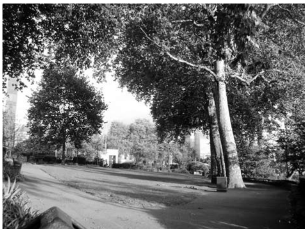
Ryc. 7. Tower Hill Gardens.

Zlokalizowany koło zachowanych murów miejskich, znajduje się w strefie ochrony konserwatorskiej. Przeprojektowany w 2010 roku w celu stworzenia nowego placu zabaw, jednego z dwóch takich obiektów w City. Wielkość: 0,2219 ha. Dostępny bez ograniczeń, ogrodzony. Zielen: nawierzchnia trawiasta, drzewa, rabaty kwiatowe. Inne elementy wyposażenia: ławki, urządzenia placu zabaw dla dzieci.