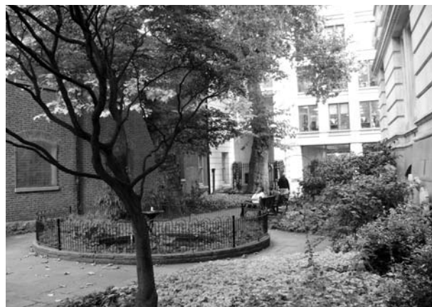
Ryc. 5. Postman's Park.

roku dla uczczenia złotego jubileuszu królowej Wiktorii. Wielkość: 0,2648 ha, o wąskim, wydłużonym kształcie. Dostępny, zamykany o zmierzchu, ogrodzony. Znajduje się w strefie konserwatorskiej, a drzewa objęte są ochroną. Zieleń: kilka starych platanów, kasztanowiec, figowiec, topola, rabaty kwiatowe, trawniki. Inne elementy wyposażenia; fontanna, źródelko, ławki.