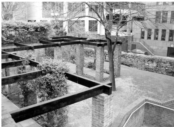
Ryc. 8. Cleary Garden

Ogród tarasowy, powstał po bombardowaniu, w miejscu dawnych łaźni rzymskich. W okresie średniowiecza kupcy winni uprawiali w tym miejscu winorośl. Został ufundowany w 1982 roku przez Związek Metropolitalnych Ogródów Publicznych w setną rocznicę powstania. Nazwany imieniem F. Cleary'ego, zwolennika zakładania terenów otwartych w City. Przeprojektowa-