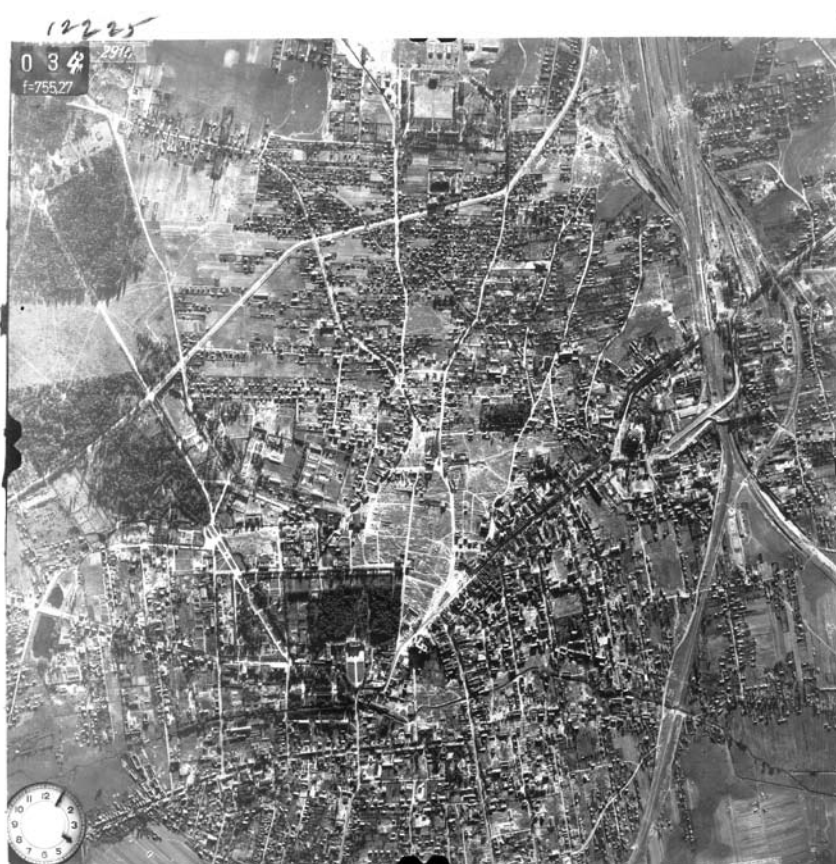
Ryc. 3. Zdjęcie lotnicze Luftwaffe, National Archives College Park, wrzesień 1944r. Ukazuje zniszczenia na obszarze śródmieścia Biłogostoku.