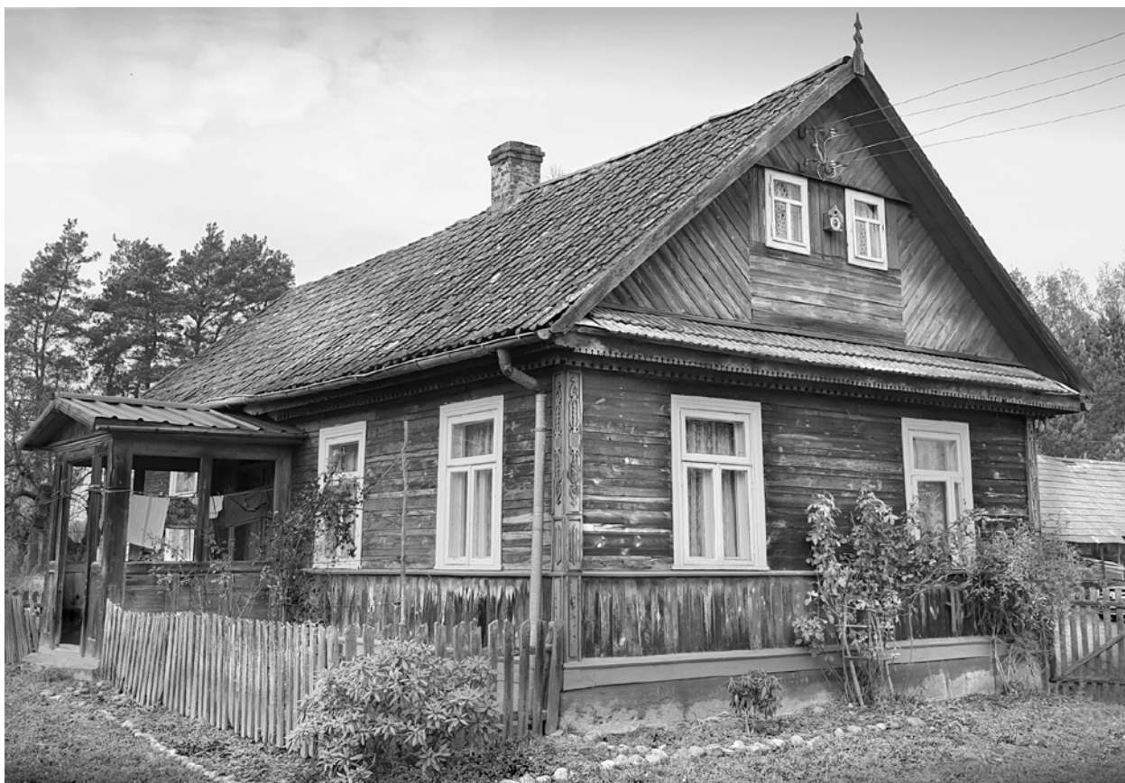
Ryc. 7. Dom od strony ulicy; fot. M. Ładny, 2018

Fig. 7. The main perspective view of the house; photo by M. Ładny, 2018