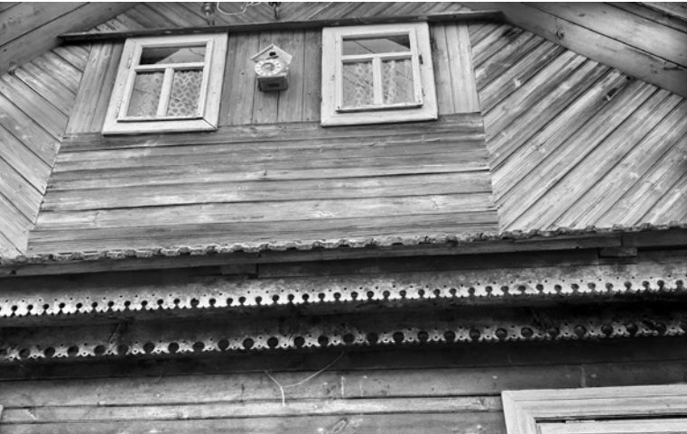
Ryc. 4. Ozdobnie szalowany szczyt domu w Miniewiczach; fot. M. Ładny, 2018