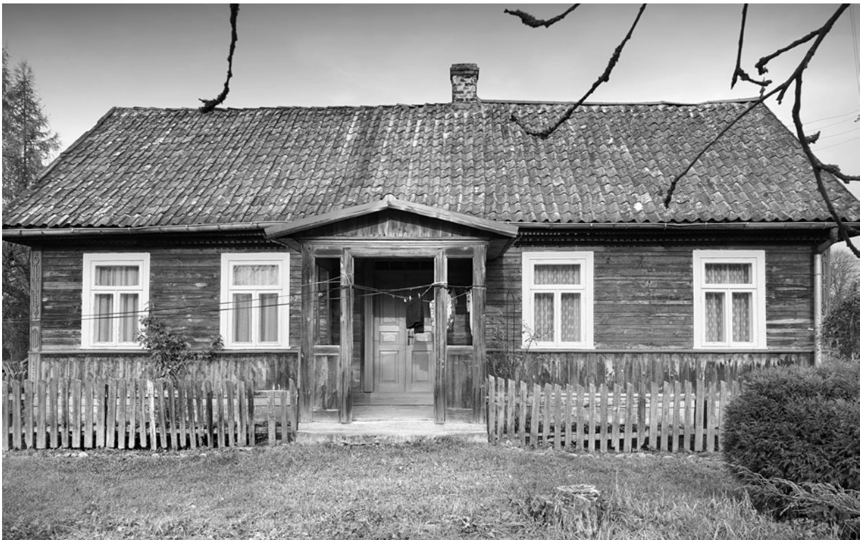
Ryc. 1. Elewacja frontowa domu w Miniewiczach; fot. M. Ładny, 2018

Drewniany zrębowy dom parterowy, półsymetryczny z sienią na osi ( dom szerokofrontowy w terminologii etnograficznej; ryc. 1-3), oszalowany ozdobnie frezowanymi listwami oraz niefrezowanymi deskami, został wzniesiony dla dość zamożnej, jak na tamte czasy, rodziny, o czym mogą świadczyć jego rozmiary, solidność i wysoki poziom wykonawczy konstrukcji oraz dobry poziom (artystyczny i warsztatowy) zdobnictwa architektonicznego (ryc. 4-6).