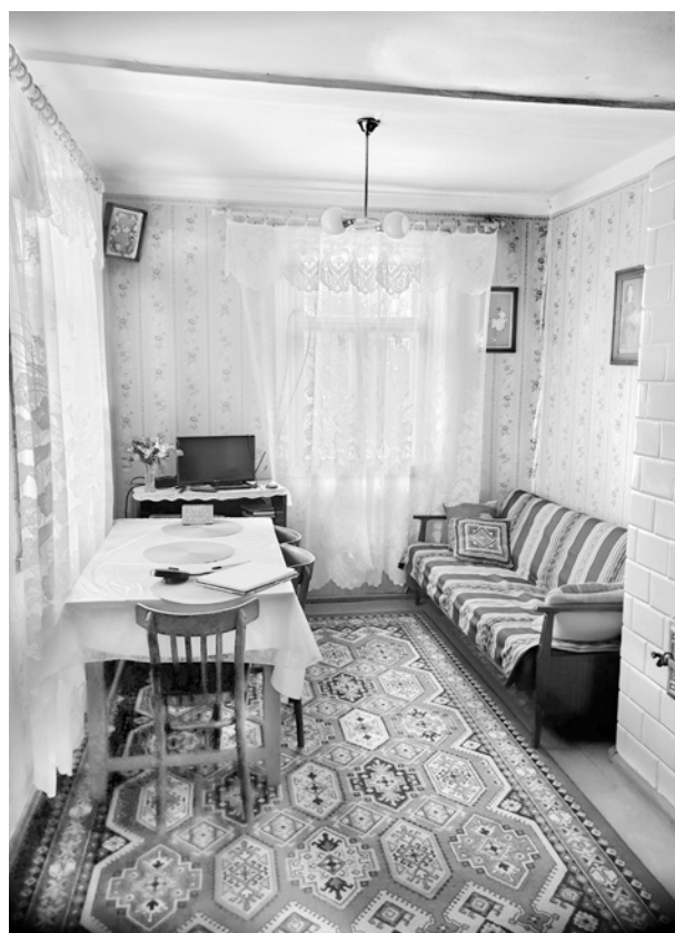
Ryc. 25. Alkierz; fot. M. Ładny, 2018