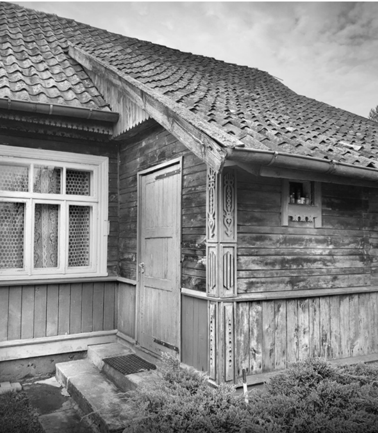
Ryc. 9. Tylna dobudówka do domu w Miniewiczach