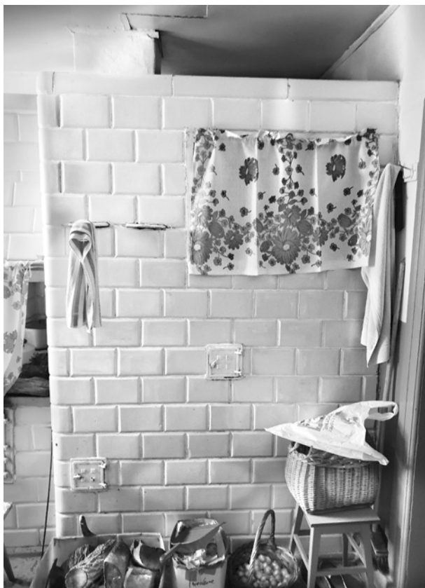
Ryc. 24. Bok pieca kuchennego z widocznymi dwoma szybrami (regulującymi „ciąg letni” i „ciąg zimowy”) oraz składowym „zapieckiem”; fot. M. Ładny, 2018