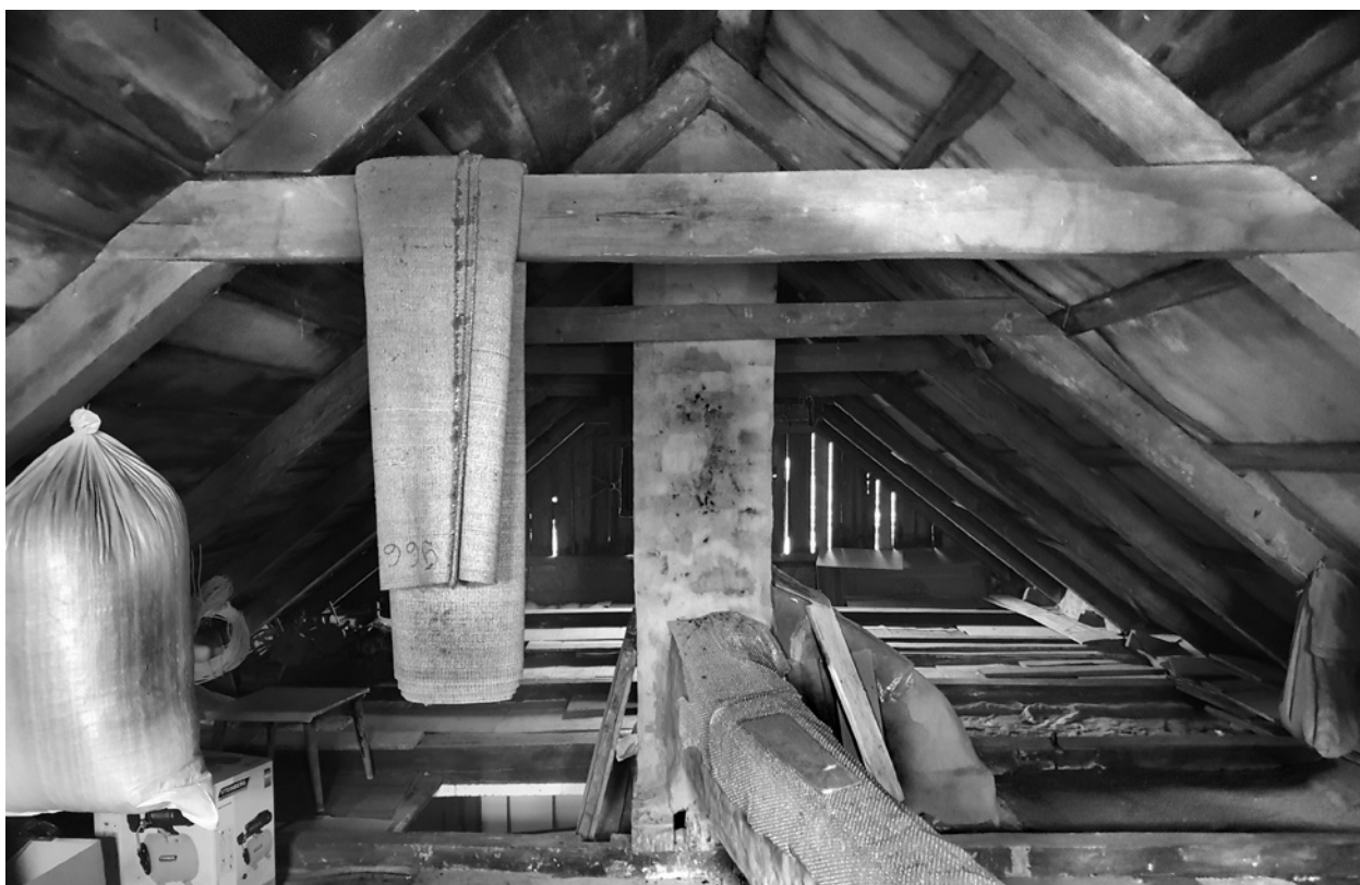
Ryc. 19. System leżaków łączących piec z kominem Fig. 19. The chimney with its multiple smoke flues