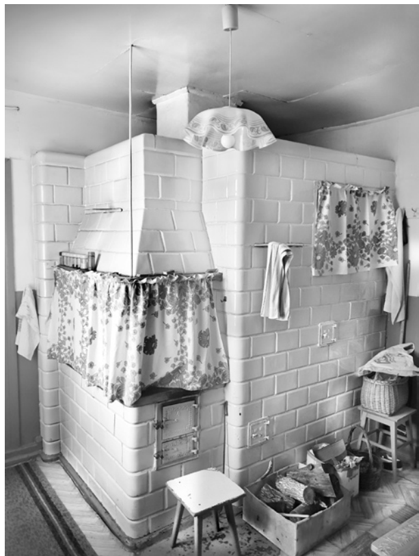
Ryc. 10. Masywny piec kaflowy w kuchni badanego domu; fot. M. Ładny, 2018

Funkcjonalnie istotna okazuje się tylna dobudówka, bo mieści ona nie tylko sień i łazienkę, ale też pod nią – a właściwie pod łazienką – znajduje się zasklepi-ona piwnica na ziemniaki i warzywa (ryc. 14) z górnym otworem zasypowym. Całość układu stanowi więc pomysłowe rozwinięcie dość częstego na tych terenach układu domu szerokofrontowego, symetrycznego, z podwójną okotopieczową amfiladą pomieszczeń, przy czym rozwinięcie układu odpowiadało aspiracjom relatywnie zamożnej rodziny gospodarzy w latach międzywojennych, kiedy to zaczął powstawać ten dom (tylko łazienka we wzmiankowanej tylnej dobudówce powstała chyba nieco później).