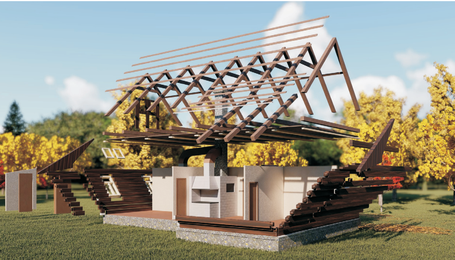
Ryc. 28. Trójwymiarowy model badanego domu (próba dekompozycji konstrukcji); opracowanie: M. Ładny, 2019 Fig. 28. A virtual 3D model of the house in Miniewicz; source: M. Ładny, 2019

Zaprezentowany tu budynek pokazuje też lokalną specyfikę dwudziestowiecznych przekształceń domu wiejskiego , rozumianego już nie jednostkowo, ale jako istotne dla naszej kultury pojęcie ogólne [M. Magdziak, 2018].