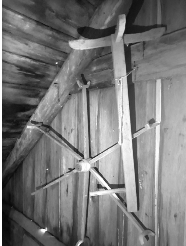
Ryc. 17. Motowidło (część warsztatu tkackiego) składowane na strychu; fot. M. Ładny, 2018

Strych, do którego dostęp umożliwiają tylko drabiniaste schody (ryc. 15), pozostaje, tak jak we wszystkich dawnych wiejskich chałupach i domach, nieużytkowy, pełniąc rolę składowi nieużywanych mebli, narzędzi i innych przedmiotów (ryc. 16-18) oraz domo-