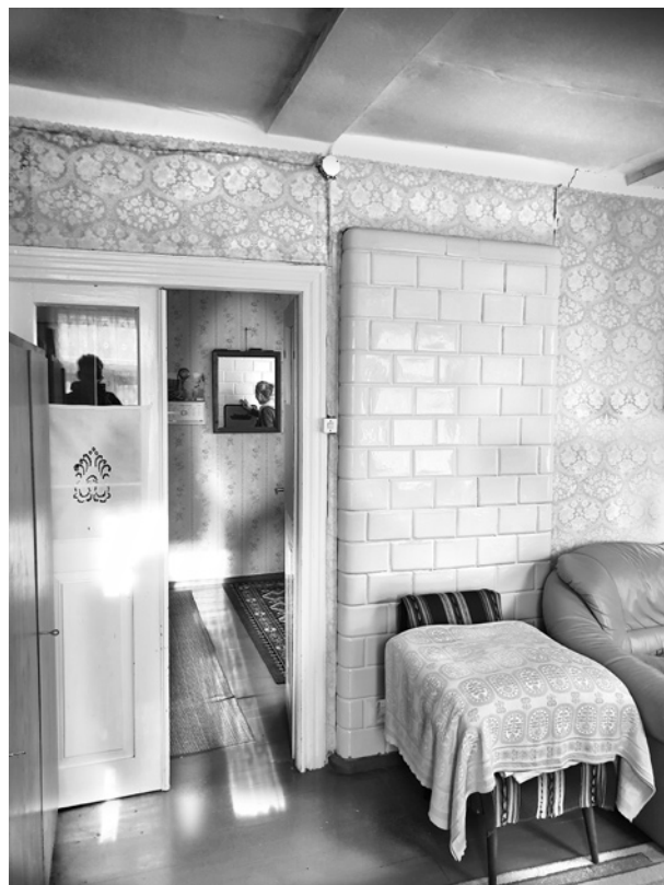
Ryc. 12. Widok z pokoju gościnnego na piec „fizyczny” i alkierz; fot. M. Ładny, 2018

Fig. 11. A tile stove between the living room and the bedroom (as seen from the bedroom); photo by M. Ładny, 2018