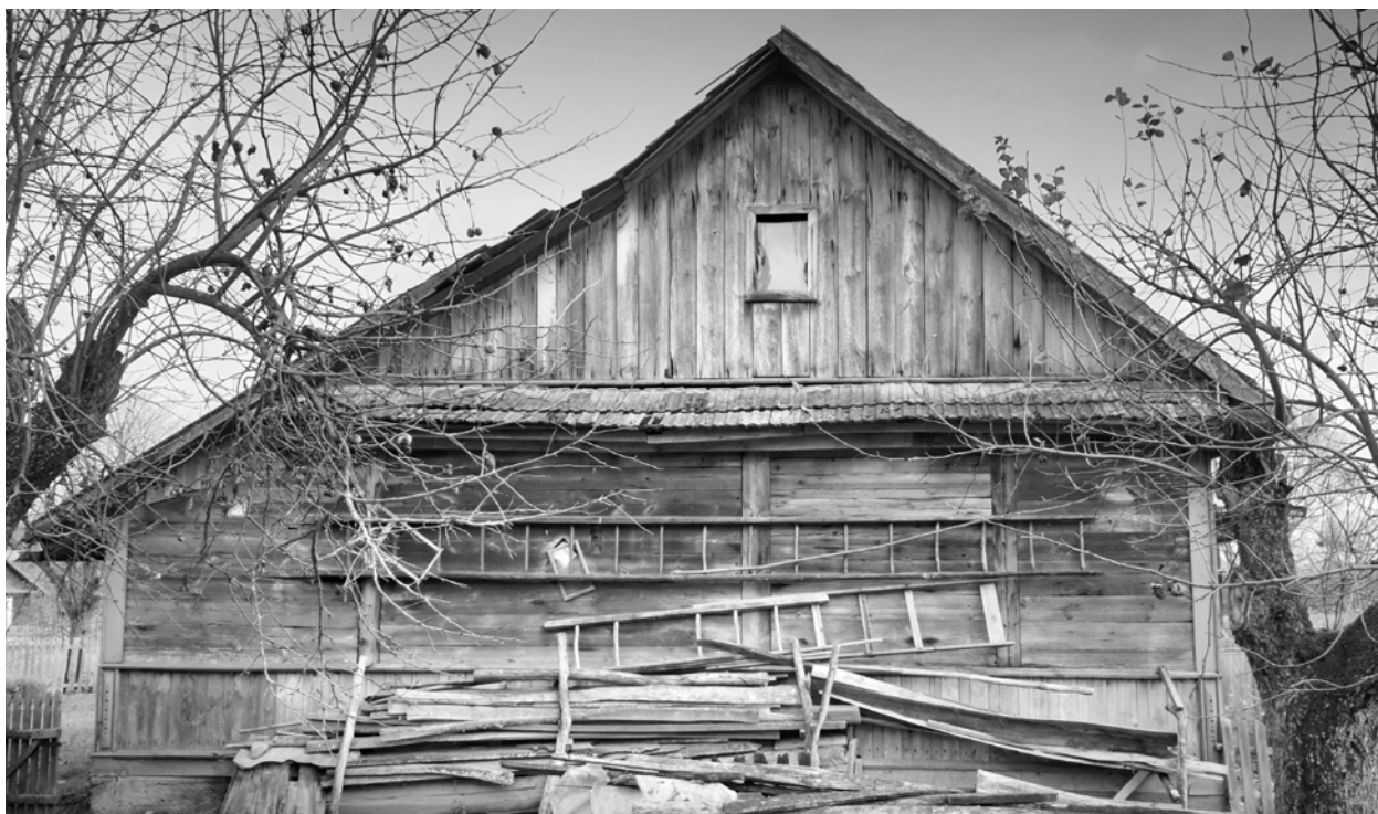
Ryc. 3. Elewacja boczna domu w Miniewiczach; fot. M. Ładny, 2018 Fig. 3. The house in Miniewiczze: gable wall; photo by M. Ładny, 2018.