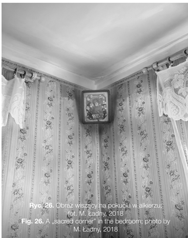
Ryc. 26. Obraz wiszący na pokuciu w alkierzu