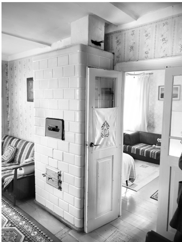
Ryc. 11. Piec „fizyczny” ogrzewający pokój gościnny i alkierz sypialny (widok z alkierza); fot. M. Ładny, 2018

Fig. 11. A tile stove between the living room and the bedroom (as seen from the bedroom); photo by M. Ładny, 2018