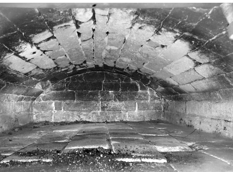
Ryc. 21. Czeluście pieca piekarskiego; fot. M. Ładny, 2018

Przewodnią zasadą wystroju pomieszczeń mieszkalnych jest wykorzystanie różnorodnych tekstyliów i tapet (ryc. 25). Zachował się też tu jeszcze relikw dawnego pokucia , mianowicie zwyczaj podkreślania symbolicznej roli jednego z kątów, między innymi za pomocą dewocjonałów (ryc. 26 i 27). Charakterystyczne dla lokalnej tradycji dwudziestowiecznej jest to, że w wiejskich domach Białostoczczyzny ozdabiano nie jeden kąt w domu, lecz po jednym kącie w każdej z izb mieszkalnych (por. Perkowska i in., 2014) – i tak jest również w badanym domu.