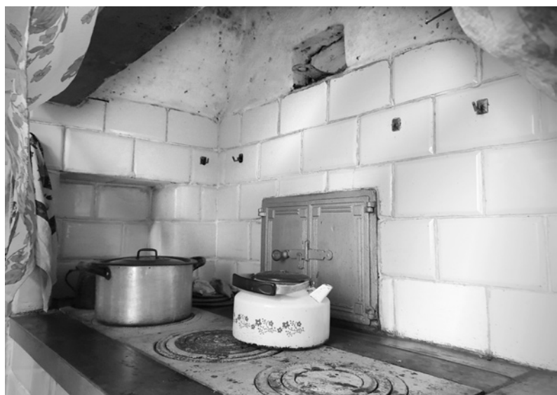
Ryc. 23. Szyber kanału dymowego znad pieca piekarskiego, ukryty pod kapą kuchenną; fot. M. Ładny, 2018

Fig. 21. A spacious bakery oven inside the main tile stove; photo by M. Ładny, 2018