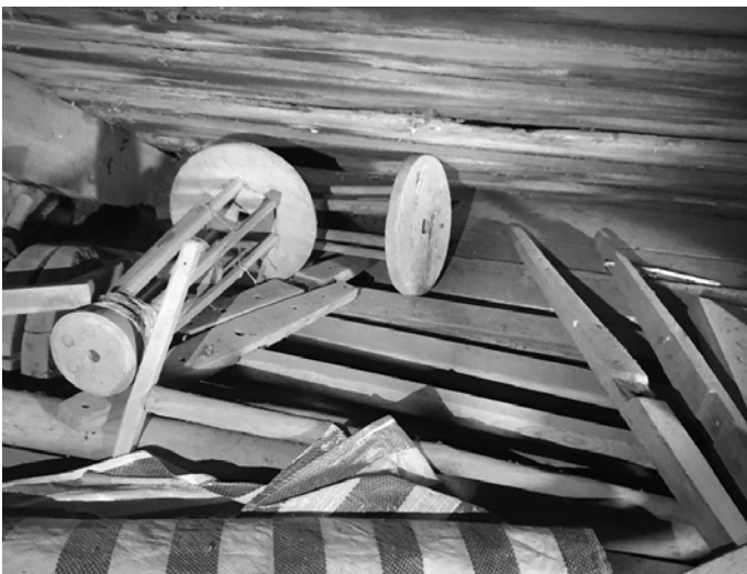
Ryc. 16. Elementy warsztatu tkackiego składowane na strychu

Dom nadal obfituje w relikty przeszłości, takie jak rozbudowane piece wielokanałowe, przy czym główny wielofunkcyjny piec ma też obszerne palenisko piekarskie z tylnym odpływem dymu (ryc. 21 i 22). System kanałów dymowych jest tu regulowany czterema szybrami (ryc. 23 i 24). Piąty szyber steruje pracą osobnego pieca ogrzewczego w alkierzu, przy czym piec ten ma nie tylko obszerne palenisko typu piekarskiego (w którym zresztą faktycznie wypiekano chleb), ale też umieszczoną nad nim „duchówkę” czyli „szabaśnik”, to jest ogrzewaną komorę do wypieków niskotemperaturowych i do przechowywania ciepłych potraw (ryc. 13).