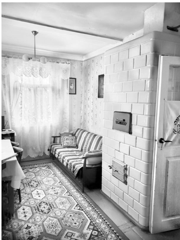
Ryc. 13. Alkierz; fot. M. Ładny, 2018 Fig. 13. The bedroom; photo by M. Ładny, 2018

Fig. 12. A tile stove as seen from the living room; photo by M. Ładny, 2018