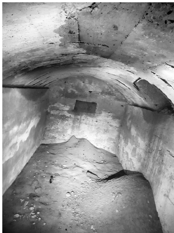
Ryc. 14. Wnętrze piwniczki; fot. M. Ładny, 2018 Fig. 14. The storage cellar; photo by M. Ładny, 2018