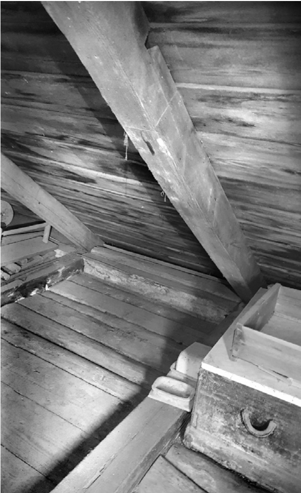
Ryc. 20. Zakątek strychu z częściowo widocznym kufrem z prawej strony; fot. M. Ładny, 2018

Fig. 20. An old storage trunk on the garret; photo by M. Ładny, 2018