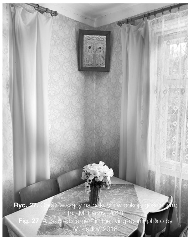
Ryc. 27. Obraz wiszący na pokuciu w pokoju gościnnym; fot. M. Ładny, 2018