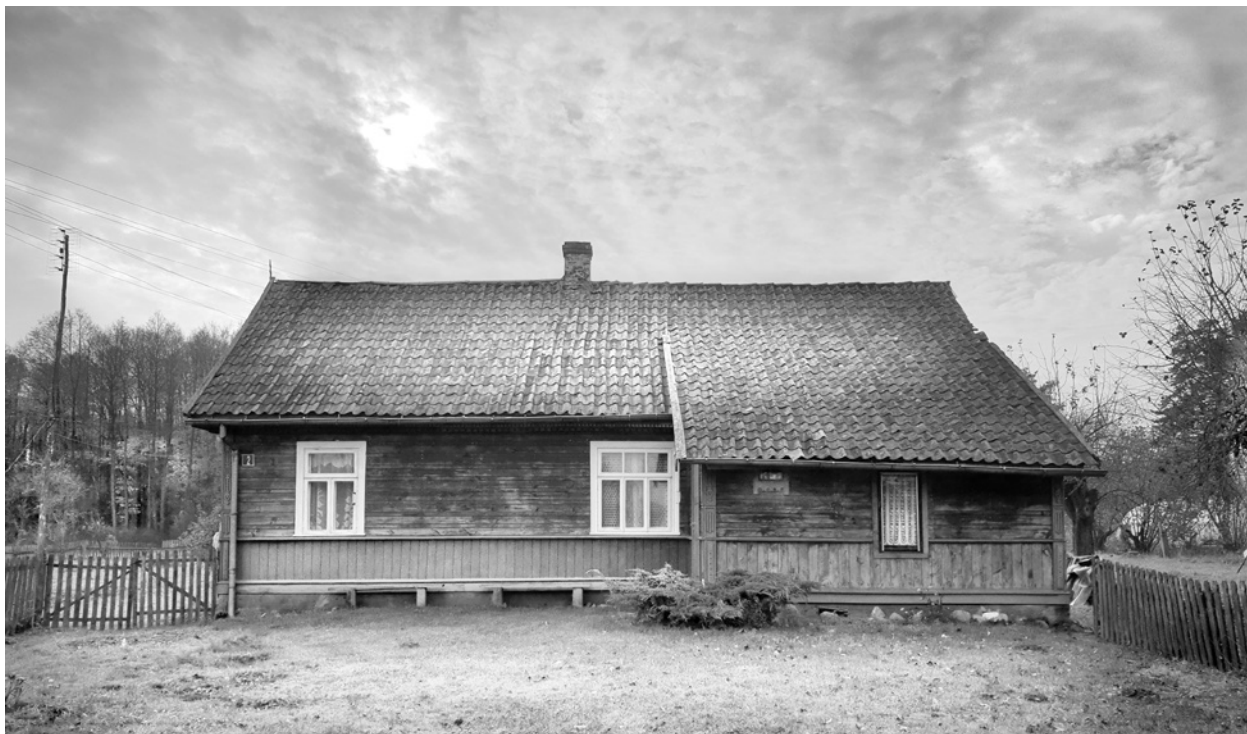
Ryc. 2. Elewacja tylna domu w Miniewiczach; fot. M. Ładny, 2018 Fig. 2. The house in Miniewiczze: back view; photo by M. Ładny, 2018