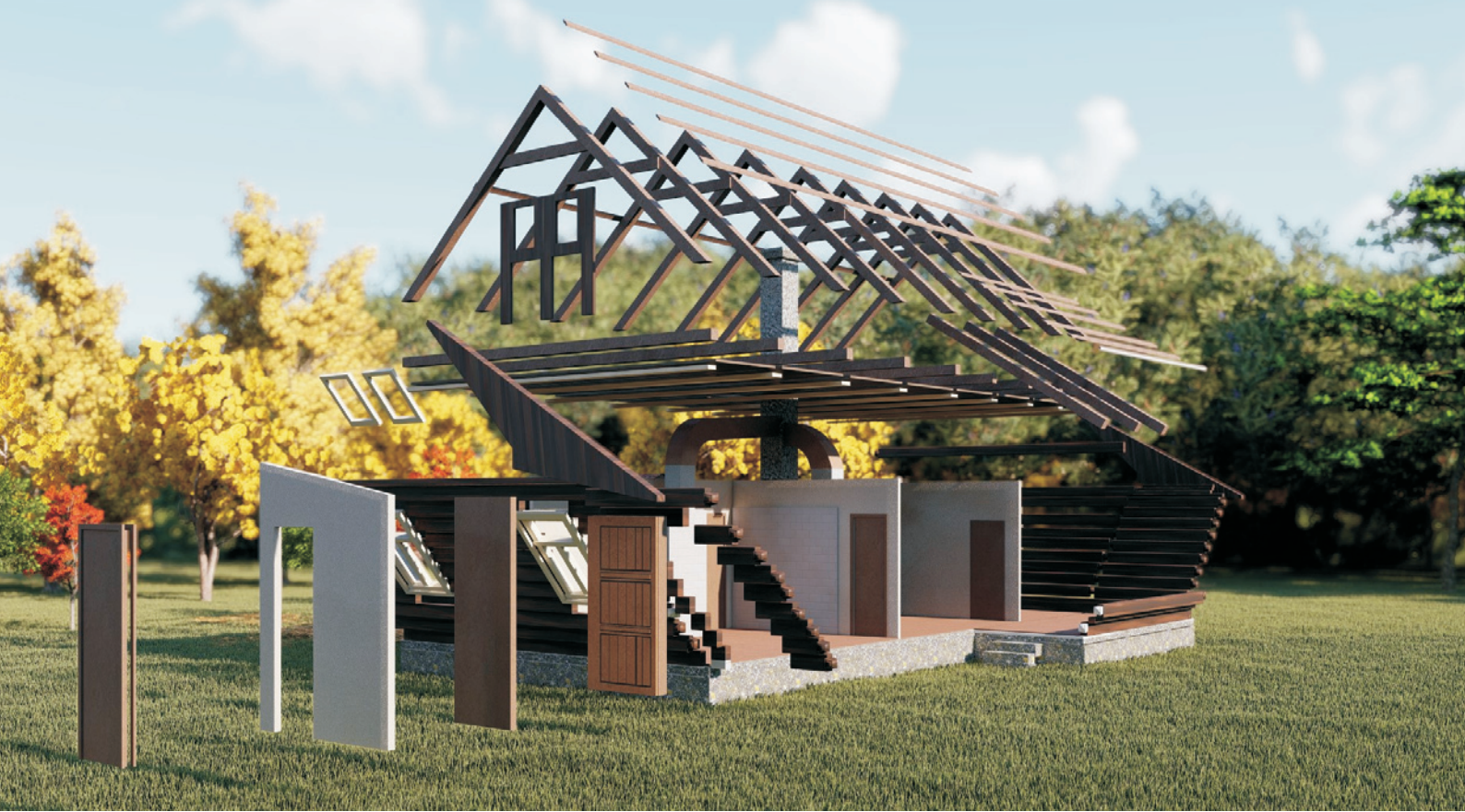
Ryc. 29. Model domu; opracowanie: M. Ładny, 2018 Fig. 29. The virtual 3D model; source: M. Ładny, 2018