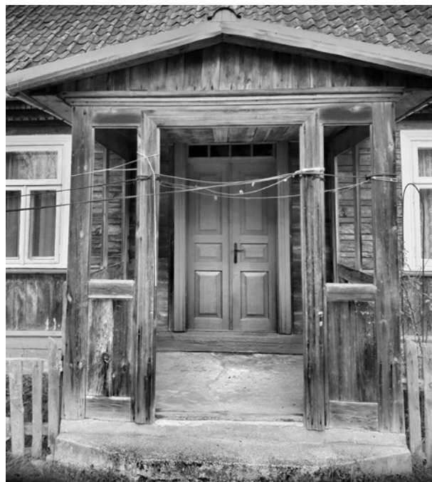
Ryc. 8. Ganek domu w Miniewiczach; fot. M. Ładny, 2018

Także frontowy odkryty ganek (widoczny na ryc. 1, 7 i 8) należy zaliczyć do kategorii zdobień, jako że w domach wiejskich odkryte ganki były raczej oznaką prestiżu wyrażonego we wzbogaconej tymże gankiem zewnętrznej formie domu, natomiast raczej nie pełniły one funkcji użytkowych. Owszem, można było w niedzielę usiąść na gankowej ławce, lecz czyniono to co najwyżej wyjątkowo. Co ciekawe, tu ganek wykonano nieco inaczej niż zwykle w przypadku spotykanych