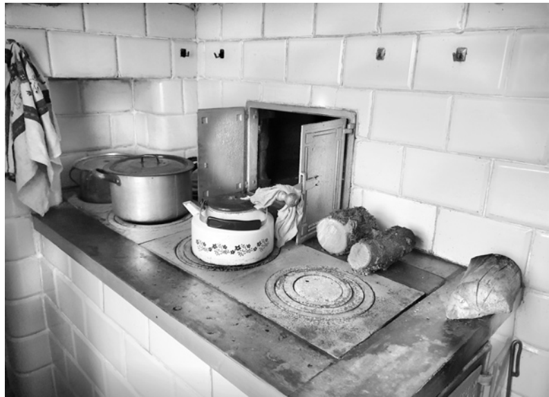
Ryc. 22. Widok na „angielkę” (płyte kuchenną z fajerkami) i drzwiczki do pieca piekarskiego; fot. M. Ładny, 2018

Fig. 20. An old storage trunk on the garret; photo by M. Ładny, 2018