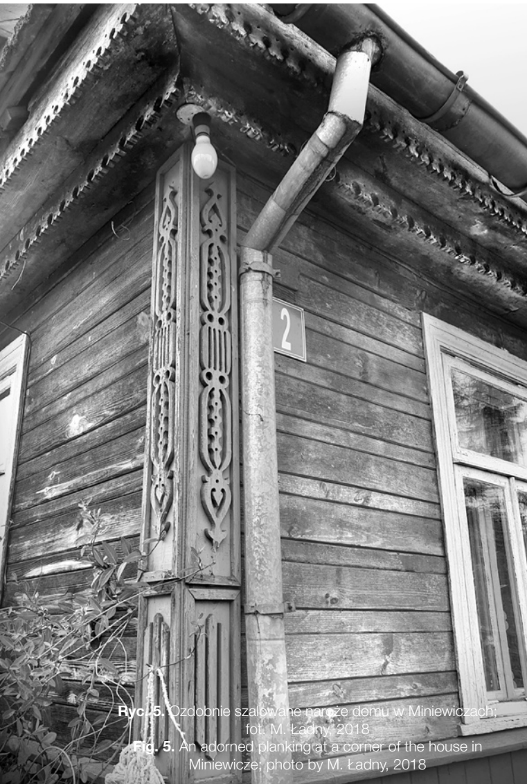
Ryc. 5. Ozdobnie szalowane naroże domu w Miniewiczach; fot. M. Ładny, 2018