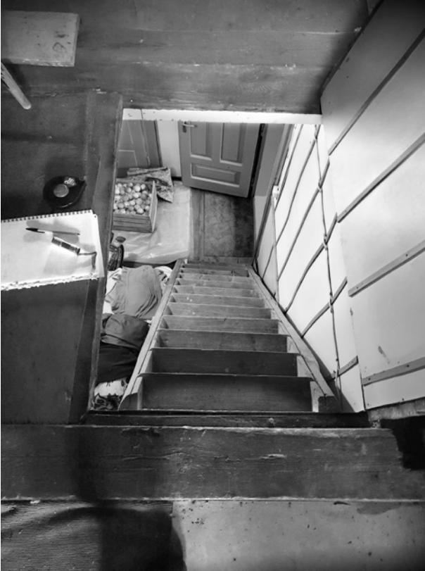
Ryc. 15. Schody drabiniaste prowadzące z sieni na strych (tu widok ze strychu); fot. M. Ładny, 2018