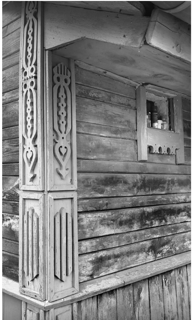
Ryc. 6. Ozdobnie szalowane naroże dobudówki do domu w Miniewiczach; fot. M. Ładny, 2018