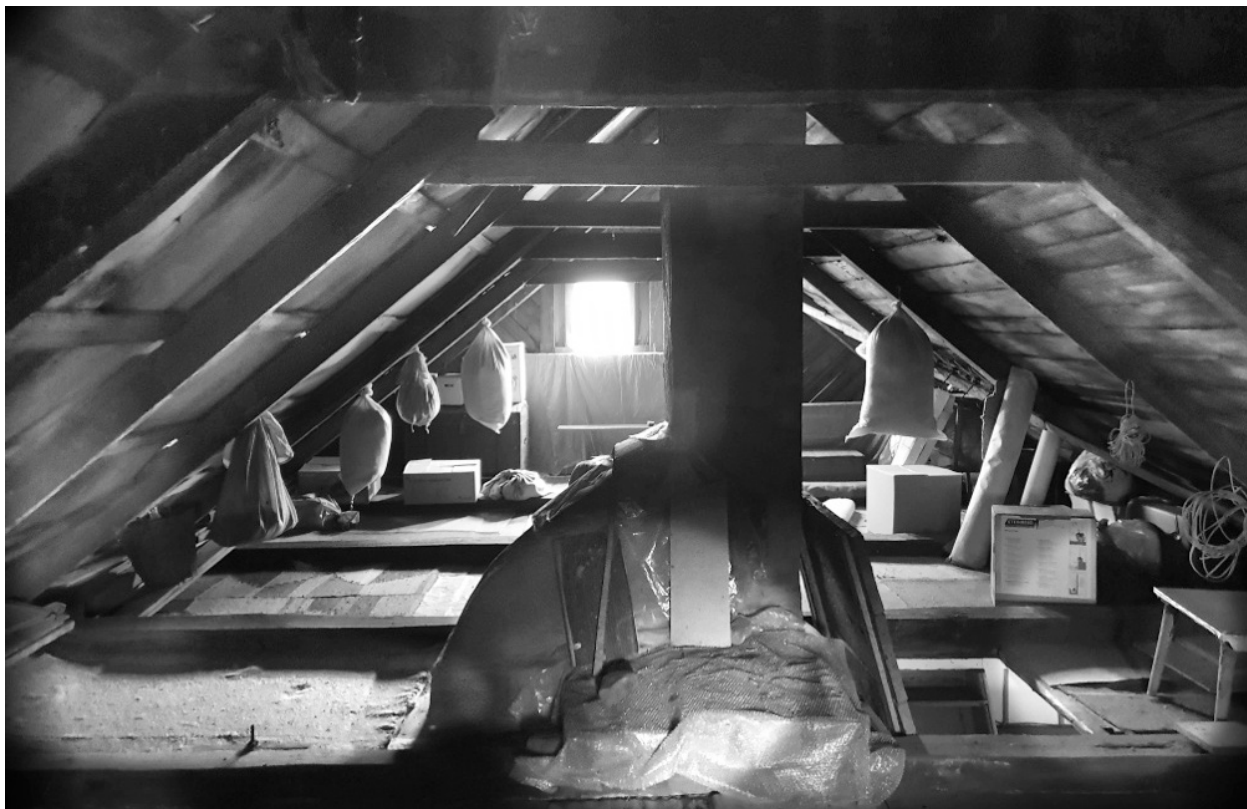
Ryc. 18. Strych; fot. M. Ładny, 2018 Fig. 18. The garret; photo by M. Ładny, 2018